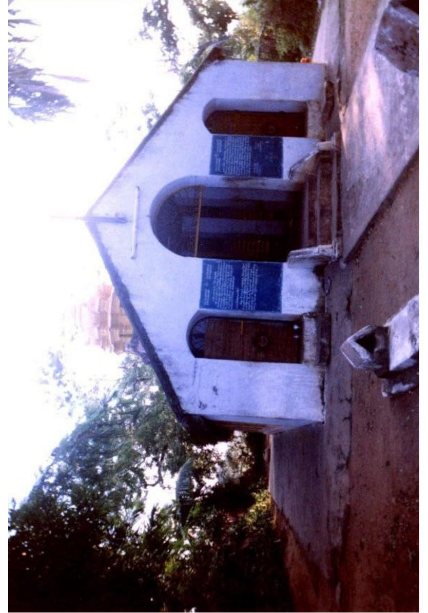
ஆண்டு நவம்பர் மாதம் 13 ம் நாள் இறந்து போனார் .

வருந்தி படுத்த படுக்கையாகி நோய்வாய்ப் பட்டு 1903 ம்